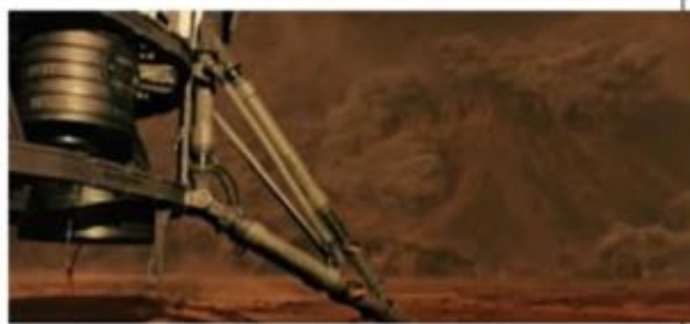
Le véhicule ascensionnel martien (VAM) au premier plan à gauche ; la tempête en arrière-plan.

Dès les premières minutes du film, une violente tempête fait hurler les vents, soulever de gros débris, secouer la base martienne et surtout... fait dangereusement pencher le vaisseau d'évacuation de l'équipage. Celui-ci est alors contraint de décoller au plus vite, sans Mark Watney.