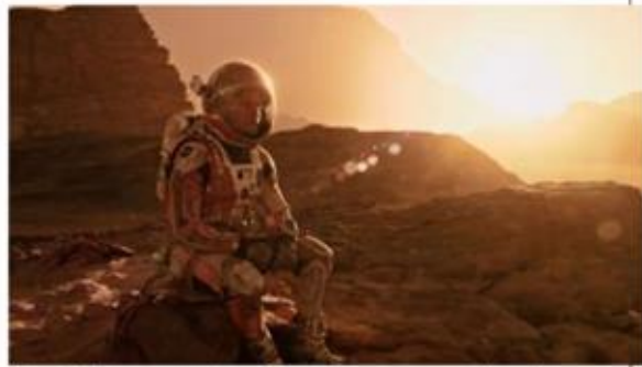
Mark Watney, seul sur Mars dans son scaphandre.

Mark Watney est alors livré à lui-même seul sur Mars. Dès qu'il sort de la base pour explorer la planète, il porte un scaphandre. Ce scaphandre est pressurisé (il permet de maintenir une certaine pression de l'air à l'intérieur de la combinaison) et la composition de l'air à l'intérieur de la combinaison est contrôlée, notamment le pourcentage de dioxygène.